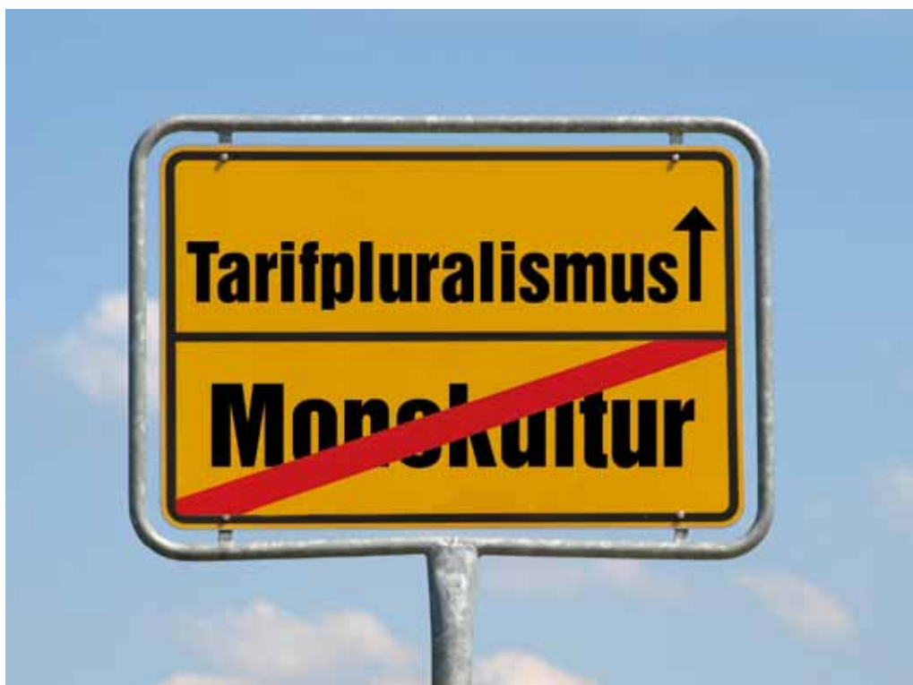
Von der Monokultur zum Tarifpluralismus

Die dbb tarifunion ist das tarifpolitische Dach von 38 Fachgewerkschaften. Die Interessen ihrer Mitglieder sind vielfältig. Pluralität, Kontroverse und Kompromiss sind Trumpf, wenn intern um die Positionierung gerungen wird. Nach außen hin ist das nicht anders! Gegenüber Arbeitgebern, aber auch in der Auseinandersetzung mit anderen Gewerkschaften steht vor dem Tarifiergebnis die Tarifauseinandersetzung. Festzustellen ist, dass die Interessenvielfalt der Beschäftigten in den letzten Jahren zugenommen hat. Bei der Vielfalt an Aufgaben und Berufsbildern im Öffentlichen Dienst ist dies auch kein Wunder! Festzustellen ist aber auch, dass die Tarifpartner in der Bundesrepublik ihre Aufgabe in den letzten 60 Jahren gut gelöst haben. Frei von gesetzgeberischen Bevormundungen. Das Zauberwort für diesen Erfolg war und ist Tarifautonomie!