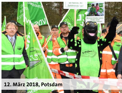
12. März 2018, Potsdam