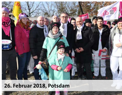
26. Februar 2018, Potsdam