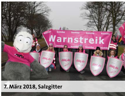
7. März 2018, Salzgitter