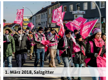
1. März 2018, Salzgitter