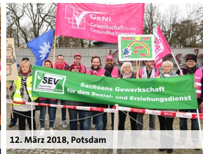
12. März 2018, Potsdam