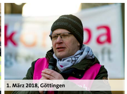
1. März 2018, Göttingen