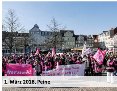
1. März 2018, Peine