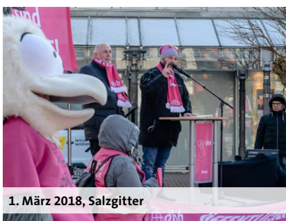
1. März 2018, Salzgitter

Wir werden wie bisher unter Berücksichtigung der Systemunterschiede zwischen den Beamten und den Tarifbeschäftigten darauf hinwirken, dass die entsprechenden finanziellen Volumina auch im Be-