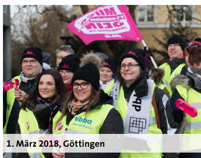
1. März 2018, Göttingen