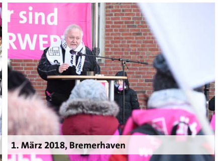
1. März 2018, Bremerhaven