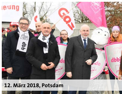
12. März 2018, Potsdam