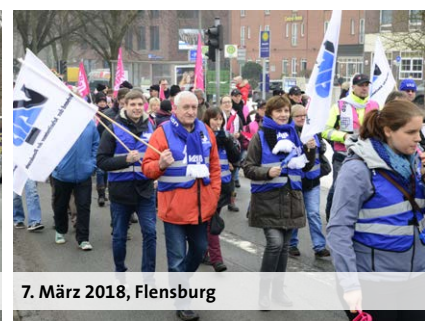
7. März 2018, Flensburg