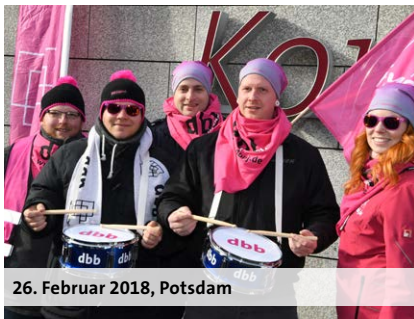
26. Februar 2018, Potsdam