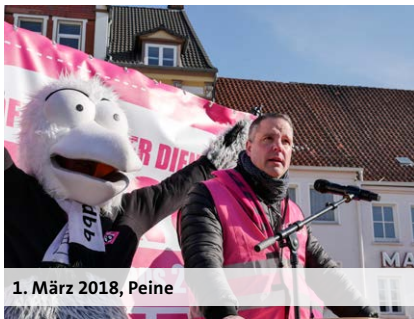
1. März 2018, Peine