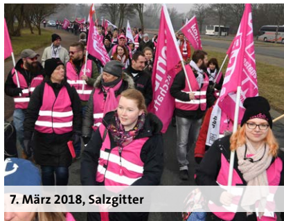
7. März 2018, Salzgitter