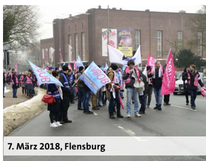
7. März 2018, Flensburg