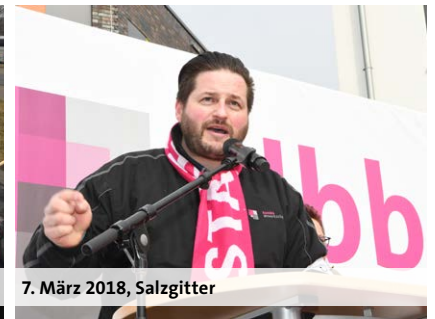
7. März 2018, Salzgitter

amtenbereich ankommen. Dieses geschieht aber außerhalb von Einkommensrunden, also quasi im Rahmen unserer laufenden Aufgaben. Das beste Beispiel dafür sind Stellenhebungsprogramme. Natürlich steht nach dieser Einkommensrunde außerdem der Einstieg in die Reduzierung der Wochenarbeitszeitverpflichtung der Bundesbeamten bei uns ganz oben auf der Agenda.