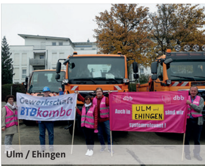
Ulm / Ehingen