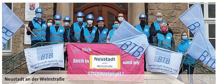
Neustadt an der Weinstraße