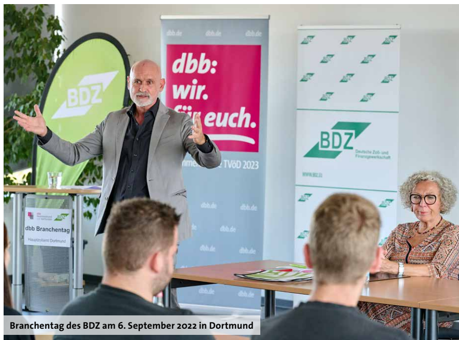
Branchentag des BDZ am 6. September 2022 in Dortmund

in schwerer Zeit ein gutes Ergebnis erzielen.“ Mit diesen Worten schwor dbb Tarifchef Volker Geyer am 6. September 2022 in Dortmund Kolleginnen und Kollegen des BDZ – Deutsche Zoll- und Finanzgewerkschaft aus dem Hauptzollamt Dortmund auf die kommenden Monate ein. Bis zum 11. Oktober 2022, dem Tag, an dem die Bundestarifkommission die Forderung zur Einkommensrunde beschließen wird, finden bundesweit zahlreiche Branchentage statt. Ziel ist es, intern mögliche Forderungen zu diskutieren und ihre Durchsetzbarkeit zu prüfen. „Denn es ist klar, Forderungen ohne Aktionsfähigkeit sind bloß eine Wunschliste“, wies Geyer direkt zu Beginn auf die Bedeutung hin, die die Mitarbeit aller Fachgewerkschaften und aller Mitglieder hat. Von der TVöD-Einkommensrunde sind die Arbeitnehmenden der Kommunen sowie die Arbeitnehmenden und Beamtinnen und Beamten des Bundes direkt oder indirekt betroffen.