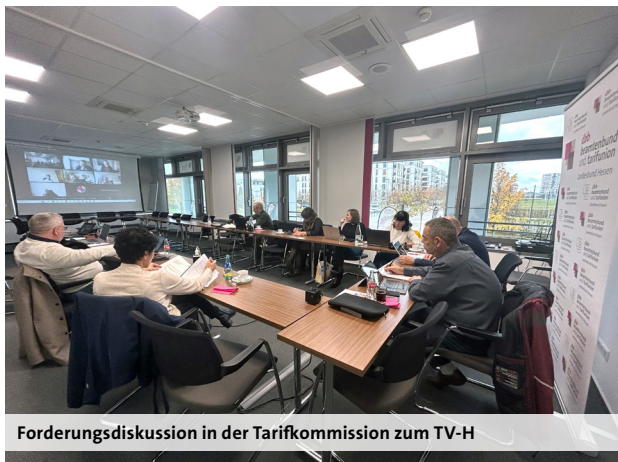
Forderungsdiskussion in der Tarifkommission zum TV-H