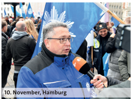
10. November, Hamburg