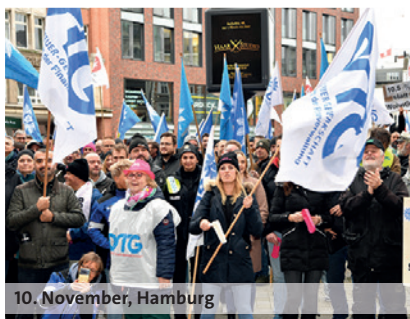
10. November, Hamburg