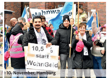
10. November, Hamburg